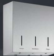
HANDPFLEGE- KOMBINATION WP 575 LINIE Wandmontage