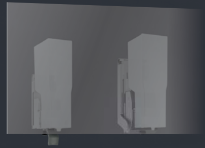
DESINFEKTIONS- MITTELSPENDER WP 174-7 LINIE Hinterspiegelmontage