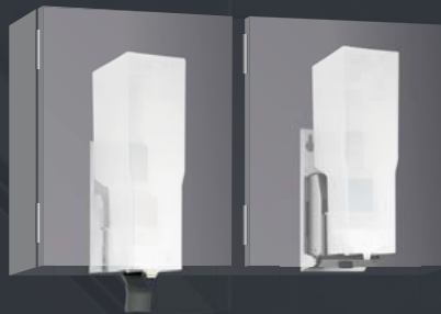
DESINFEKTIONS- MITTELSPENDER WP 173-7 LINIE Schrankmontage