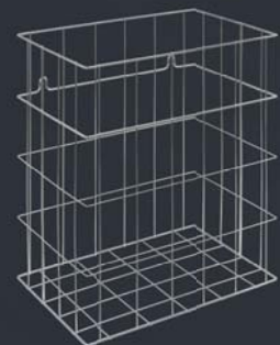
ABFALLKORB WP 201 LINIE 35 Liter