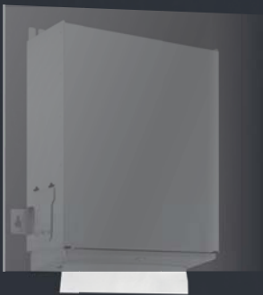
PAPIERHANDTUCH- SPENDER WP 176-1 LINIE Hinterspiegel- montage