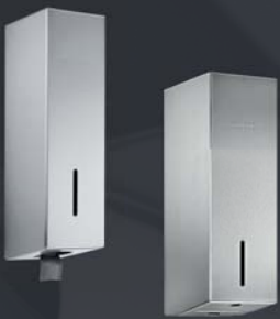
DESINFEKTIONS- MITTELSPENDER WP 102-7 LINIE Wandmontage